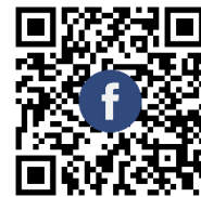
เพจเฟซบุ๊ก OBEC FILM